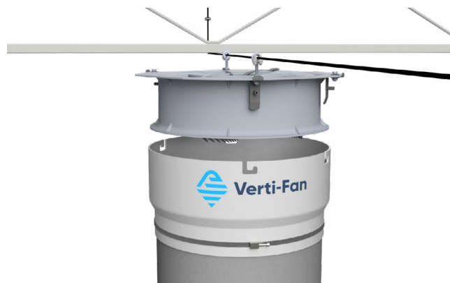
Montagering van de Verti-Fan

Met de nieuw ontwikkelde montagering is het heel eenvoudig geworden om de slurf aan de ventilator te monteren. Van te voren wordt de precies op maat gemaakte slurf aan de montagering gemonteerd. Door de juiste maatvoering zit de slurf mooi strak om deze ring. Met een rvs slangenklem wordt de slurf vastgemaakt aan de ring. De montagering met gemonteerde slurf is heel eenvoudig met de montagepennen aan de ventilator 'te klikken', door de uitsparing in de montagering over de afstandbussen te plaatsen.